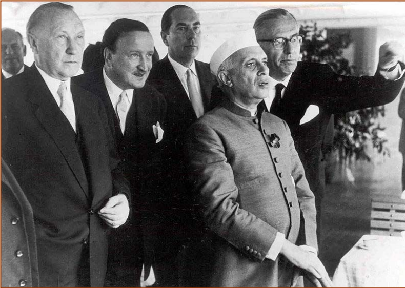
Konrad Adenauer mit Hermann Josef Abs beim Staatsbesuch Nehrus 1956. Dieses Bild wurde unter den Bedingungen der Creative Commons Namensnennung-Weitergabe unter gleichen Bedingungen 3.0

hielt. Nachdem er sich ausführlich zu den Verträgen und Protokollen zwischen den Besatzungsmächten geäußert hatte, sagte er: