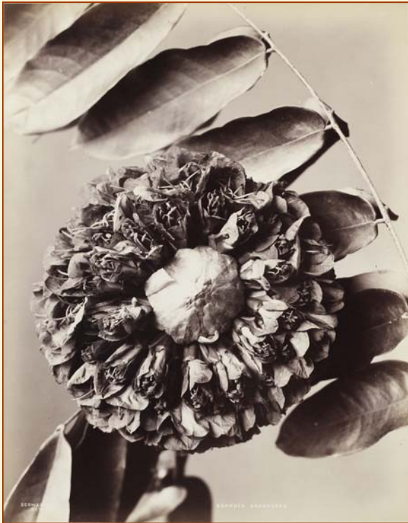
Abb.: Charles T. Scowen: Brownia Grandiceps , Ceylon 1870er Jahre © SMB, Museum für Asiatische Kunst

05.11.09 - 31.01.10 Staatliche Museen zu Berlin - Museum für Asiatische Kunst