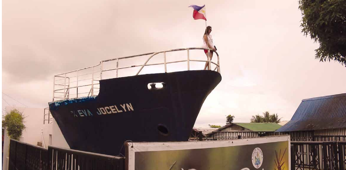
Supertaifun Yolanda/Haiyan zerstörte im November 2013 weite Teile der Visayas Region und trieb ganze Frachtschiffe ins Landesinnere. Die Stadt Tacloban in Leyte befindet sich seither im Wiederaufbau. Das Schiffswrack in Tacloban erinnert täglich an die verheerenden Auswirkungen des Klimawandels und ist Mahnmal zugleich.

aktivist*innen in Sicherheit und Freiheit wiegen, ihren Aktivismus auszuführen, ohne dabei von einer geheimen Staatspolizei bespitzelt oder aufgrund von Posts in den Sozialen Medien als Terrorist*in verdächtigt zu werden. In den Philippinen ist das jedoch die Realität und der Aktivismus kann lebensgefährlich sein. Da erscheint es nicht zum Lachen, wenn sich hiesige Klimaaktivist*innen vor dem Brandenburger Tor am Galgen fotografieren lassen.