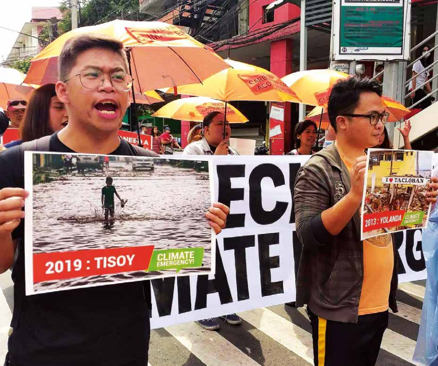
Klimaproteste am Mendiola Arch (Metro Manila) im November 2019, kurz nachdem der Taifun Tisoy die Philippinen verwüstete.

nialen Verknüpfungen können nicht als Vergangenheit abgetan werden. Synchron sind die Exporte an Plastikmüll und Elektroschrott des globalen Nordens in Länder des globalen Südens wie die Philippinen der entgegengesetzte Kreislauf. In beiden Kreisläufen aber profitiert der globale Norden an der Ausbeutung des globalen Südens und der indigenen Bevölkerung. Konzerne wälzen gerne die Pflicht auf die Konsumierenden ab, sich für den nachhaltigen Konsum und die Wahl zu „Fair Trade“ oder „unverpackt“ zu entscheiden, statt dass man sich gegen jene ausbeutenden Großkonzerne stellt und diese anprangert. Jedoch muss sich jede*r im globalen Norden beim Kleingedruckten zur Nachhaltigkeit und bei der Wahl zu „Fair Trade“ gründlich überdenken, was hinter dem Greenwashing an „unsichtbarer“ kolonialer Ausbeutung doch noch drinsteckt.