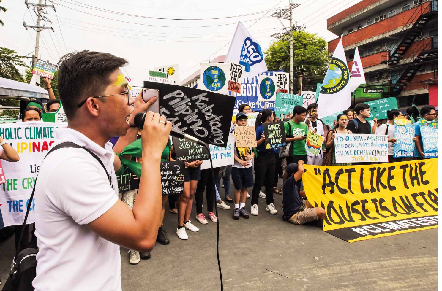
Viele hunderte junge Klimaaktivist*innen beteiligten sich am ersten global youth climate strike wie hier in Metro Manila am 24. Mai 2019. In den philippinischen Städten Cebu, Davao, Iloilo, Koronadal, Bacolod, General Santos, Tacloban, Antipolo, Pangasinan und Bulacan sowie weltweit fanden ebenfalls große Klimastreiks statt. Die philippinischen Klimaaktivist*innen forderten die Duterte-Regierung auf, zügige und ehrgeizige Maßnahmen als Antwort auf die Klimakrise zu ergreifen, da die Philippinen weltweit mit am meisten von den Auswirkungen des Klimas betroffen sind.