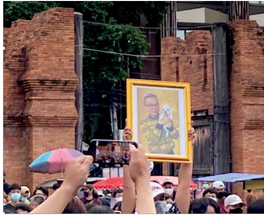
Demonstration in Chiangmai am 19. Juli 2020. Demonstrierende halten ein in Gold gerahmtes Foto von Pavin Chachavalpongpun hoch. Einige warfen sich später davor zu Boden – eine Unterwerfungsgeste des Hofprotokolls, die zunehmend kritisiert wird.

Vielleicht bin ich selbst eher radikal oder einfach schon sehr lange in diesem Geschäft, aber ich sage Ihnen: Wenn es um soziale Bewegungen geht, dann kann man nicht erwarten, es allen Recht zu machen. Wenn Leute aus dem Ausland fragen, ob die Studierenden nicht zu weit gegangen sind, indem sie dieses Bild hochgehalten haben, nehme ich das erst mal als eine andere Meinung. Es wäre zu stark, wenn ich sagen würde, dass es mich nicht juckt. Aber ehrlich: wenn Du nicht irgendetwas besseres vorschlägst, Schätzchen, dann bleib doch einfach zuhause und schau eine Runde Absolutely Fabulous .