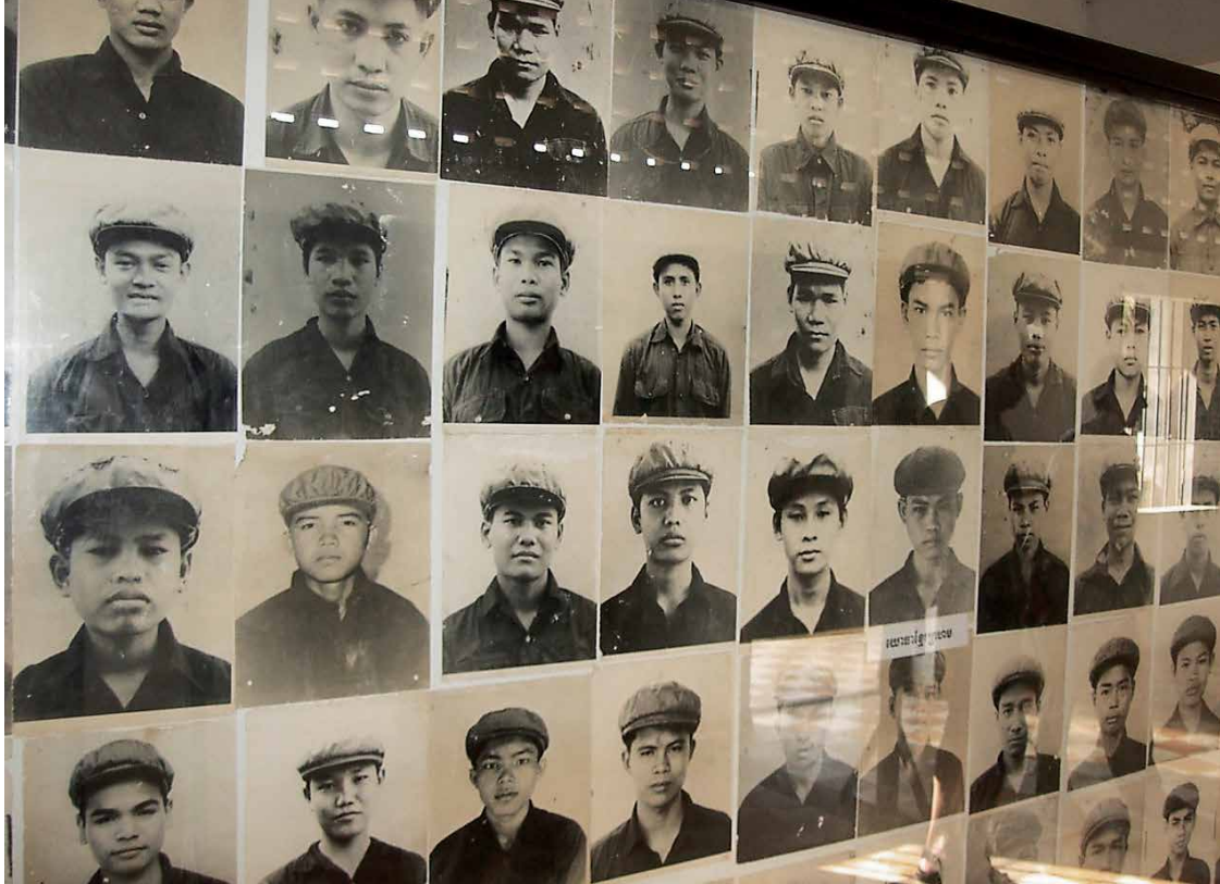
Fotos vom Personal des Gefängnisses S-21 im heutigen Tuol-Sleng-Genozid-Museum.