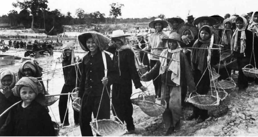
Arbeiter*innen beim Errichten eines Dammes.

Kräfte konnten keine „wahren Khmer“ sein, sie mussten dem Erzfeind der Khmer gehorchen: Es musste sich – so der Parteilogan – um „Khmer mit vietnamesischem Verstand“ handeln. Parallel dazu leisteten sich die Roten Khmer seit Anbeginn ihrer Herrschaft zudem kleinere Scharmützel mit Vietnam entlang der schlecht demarkierten Grenze. Als Vietnam dann 1977, ohne großen Widerstand zu erfahren, in den Osten des Landes einzudringen vermochte, mutmaßte die Parteiführung Verrat in der Zone Ost entlang der vietnamesischen Grenze. In der Folge flohen zahlreiche Kader vor einsetzenden innerparteilichen Säuberungen nach Vietnam. Unter ihnen Hun Sen und viele seiner heutigen Gefolgsleute in der Regierung.