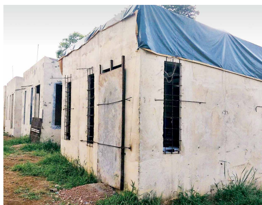
Häuser des nationalen Häuserwiederaufbauprogramms nach Taifun Yolanda, die Mängel aufweisen oder unvollständig geblieben sind, Cullion, Palawan.