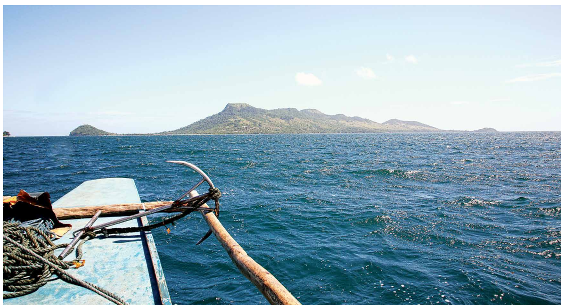
Bootsanfahrt zur Insel Sicogon.

Im Zuge von Anpassungsmaßnahmen und dem Wiederaufbau nach Yolanda wurden auf den Philippinen Umsiedlungen damit begründet, ein klimaresilienteres Lebensumfeld für die Betroffenen zu schaffen. Denn die von der Regierung 2013 eingeführte No-Dwelling-Zone , welche Betroffenen untersagt innerhalb von 40 Metern von der Hochwasserlinie bis zur Küste Häuser zu errichten, beabsichtigt diese vor weiteren Überschwemmungen und Sturmfluten zu schützen. Die Regierung plante knapp eine Million in Küsten-Hochrisikobereichen lebende Filipin@as umzusiedeln . Das schützte sie zwar vor (Sturm-) Fluten, doch ohne alternative Einkommensquelle drohte ihnen nun verschärfte Armut. NGOs wie der philippinische Think Tank IBON kritisierten diese Maßnahme stark. Während kleine Geschäfte in der verbotenen Zone zerstört wurden, blieben große Hotelanlagen, wie das Oriental Hotel in Palo in der Provinz Leyte, von den Räumungen ausgeschlossen.