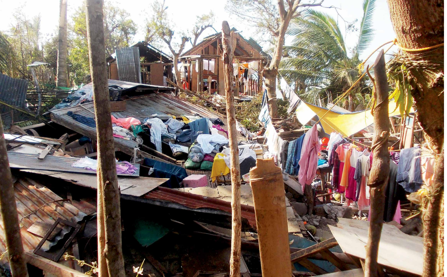
Verwüstungen nach Super-Taifun Yolanda auf der Insel Sicogon, 2013.

zwischen 1998 und 2017. Jedes Jahr ziehen rund 19 Taifune durch den Inselstaat. Die verheerenden Zerstörungen, die vor allem Super-Taifun Yolanda (international bekannt als Haiyan) im November 2013 auf den Philippinen hinterlassen hatte, eröffnen den Blick auf die bittere Realität einer jahrelang verfehlten globalen Klimapolitik und nationalen Sozialpolitik.