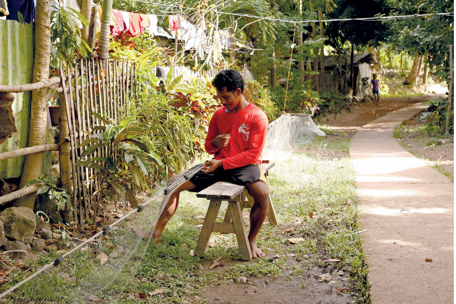
Ein Großteil der Inselbewohner*innen leben vom Fischen. Ein Fischer flickt sein Fischernetz in der Nachmittagssonne.

fehlerhaften Landkarten unrechtmäßig waren. Auf Drängen von FESIFFA leitete die Behörde im Juni 2019 eine Untersuchung der Unregelmäßigkeiten ein. Seither wartet FESIFFA auf einen Bericht.