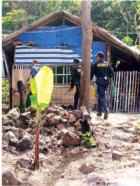
Sicherheitspersonal von Ayala und SIDECO patrouillieren auf der Insel Sicogon, September 2014.

Trotz des extremen Hungers, dem die Inselbewohner*innen nach Yolanda ausgesetzt waren, lehnten 784 Familien, die der lokalen Vereinigung „FESIFFA“ ( Federation of Sicogon Island Farmers and Fisherfolks Association ) angehören, die Angebote der zwei Unternehmen ab. Die Familien wollten sich nicht aus ihrer Heimat vertreiben lassen und nahmen den Kampf mit einer der wirkungsreichsten Unternehmen des Lan-