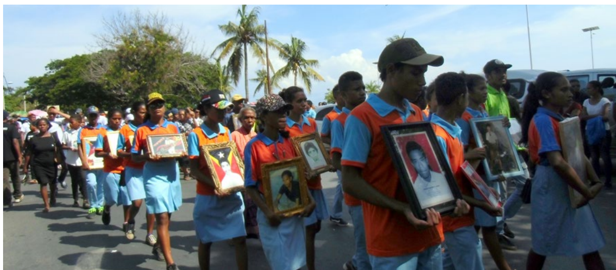
Die Jugend gedenkt der Opfer.

den. Heute muss der Beitrag der Jugend Lernen und Wissen sein. Nur so können sie zur Weiterentwicklung dieses Landes beitragen. Die Jugend hat offensichtlich viele Werte verloren, muss sich neu entscheiden, was und wem sie ihr Leben, ihre Zeit widmen will um wieder Orientierung zu finden. Deshalb ist es wichtig, zu beobachten, welche Erziehung und Angebote es momentan für die Jugend gibt, d. h. was und wie sie unterstützt werden, auch von uns »Alten« lernen können. Diejenigen, die sich der Geschichte verweigern, sich von der Vergangenheit abwenden, laufen davon, treiben sich herum, haben keine Perspektive, was auch ein Grund für Gewalt ist. Sich mit der Geschichte unseres Landes zu beschäftigen, ist etwas, das in der Familie beginnen muss. Zum Beispiel in meiner Familie: ich erziehe meine Kinder, aufgrund der Haltung und der Erfahrungen, die ich in meinem Leben gemacht habe, als Kind, vor allem als Jugendliche. Ich erzähle ihnen von meinen Erfahrungen und sie können das aufnehmen und in ihrem eigenen Leben umsetzen, Fähigkeiten üben, die ihr Leben reicher macht.