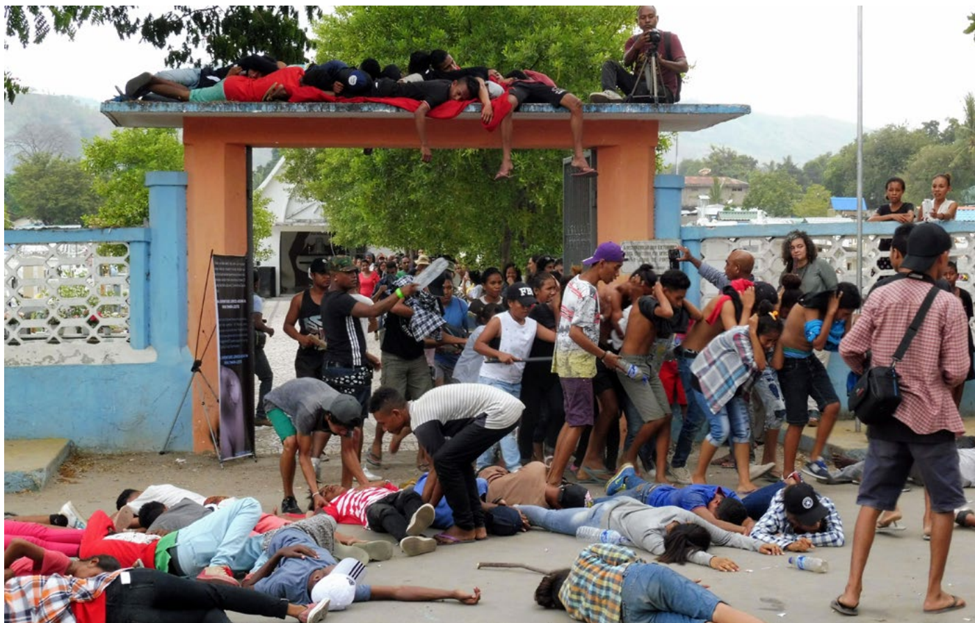
Jugendliche stellen in einem Rollenspiel die Ereignisse von vor 25 Jahren nach.