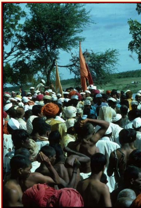
Jejuri (Maharashtra), Somvati Amavasya Fest, 1981 die Anhänger des Gottes Khandoba begleiten ihren Gott zum Fluss, um dort ein gemeinsames Bad zu nehmen

Sontheimer ging es darum, Zusammenhang und Kontinuität von klassischer Hochkultur und Volkskultur in ihrer wechselseitigen Beeinflussung deutlich zu machen und gerade der Kultur und Religion des „einfachen“ Volkes Rechnung zu tragen. Kunst, Kunstgeschichte, Archäologie, moderne Sprachen und Dialekte, schriftliche ebenso wie rein mündliche Überlieferungen, zog er zum besseren Verständnis des lebendigen religiösen Lebens und der bestehenden Kultur heran. Besonders die Traditionen der Hirtengruppen auf dem Dekhan Plateau interessierten ihn. Seine Sorge galt dem Erhalt des durch die Modernisierung Indiens vom Verschwinden Bedrohten, vor allem der mündlichen Überlieferung. Mit Tonbandgerät und Kassettenrekorder nahm er die Gesänge, Mythen, Legenden und Märchen auf, transkribierte und übersetzte sie. Er versuchte mit den damals möglichen technischen Mitteln wie Fotografie oder Filme soviel wie nur möglich von diesem religiösen Leben zu erforschen und festzuhalten.