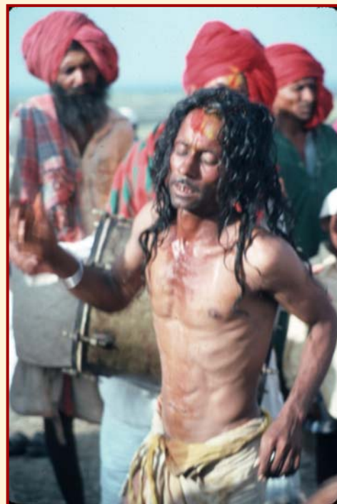
Lakadevadi (Maharashtra) Vom Gott oder einem Ahnen besessener Dhangar (Schafhirte), der als Medium fungiert und Voraussagen macht