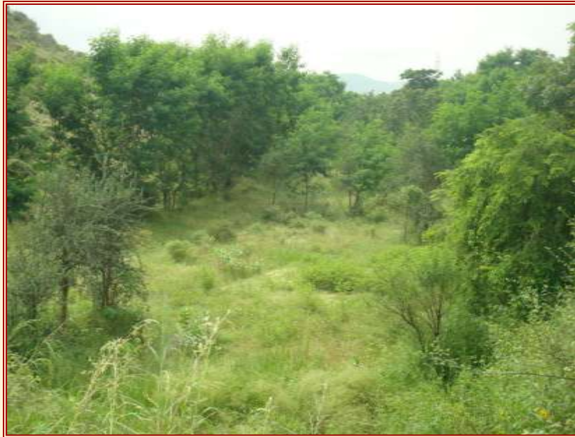
Abb. 2: Gandhivan

Sichtbares Herzstück der GBS ist der Gandhivan, „Gandhi-Wald“ (Abb. 2). Er wurde seit 1991 einem Areal von 25 ha Sanddünen abgerungen. Der Boden wurde durch geeignete Bäume und Sträucher gebunden, schnellwachsende Gehölze für die Brennholzgewinnung (durch Sammeln, nicht durch Abholzen), Futterpflanzen und heimische Baumarten sowie wirtschaftlich relevante heimische Fruchtgehölze wurden angepflanzt.