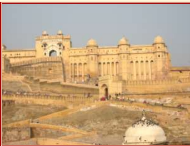
Abb. 1: Festung Amber

Amber bei Jaipur in Rajasthan – ein touristisches Highlight (Abb. 1). In die unlängst restaurierte Festung ziehen täglich Heerscharen von Touristen, die Unterstadt wird entlang der Touristenroute immer prächtiger, Führer aus Wirtschaft und Politik haben sich hier alte Palais zugelegt.