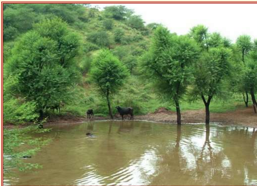
Abb. 3: See im Gandhivan

Das Wasser wurde durch Kanäle und Seitenrinnen durch die Pflanzungen geleitet, um Abschwemmungen zu unterbinden, und ein kleiner See wurde aufgestaut als Tränke für Nutzvieh und Wild (Abb. 3).